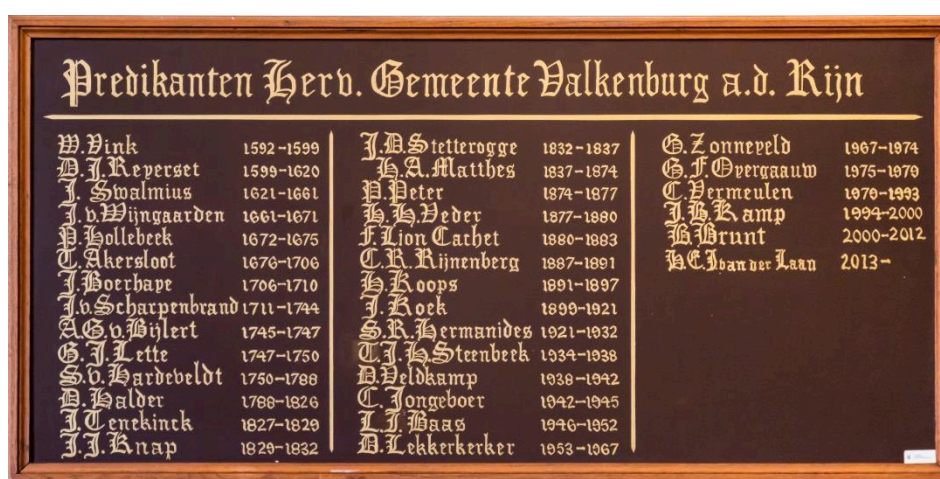
Figuur 1. Predikanten van Hervormde Gemeente van Valkenburg aan den Rijn

Op het bord achterin de kerk zijn de namen vermeld van de predikanten die in de Hervormde gemeente van Valkenburg aan den Rijn het ambt van dienaar van het Woord hebben vervuld.